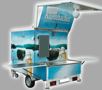
L: ca. 4,90 m B: ca. 3,20 m*