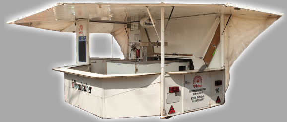
L: ca. 5,50 m - 6,50 m B: ca. 5 m*