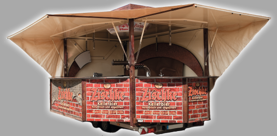
L: ca. 5,50 m - 6,50 m B: ca. 5 m*