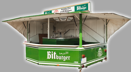
L: ca. 5,50 m - 6,50 m B: ca. 5 m*