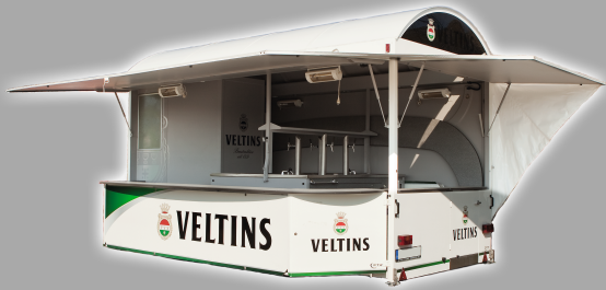
L: ca. 5,50 m - 6,50 m B: ca. 5 m*